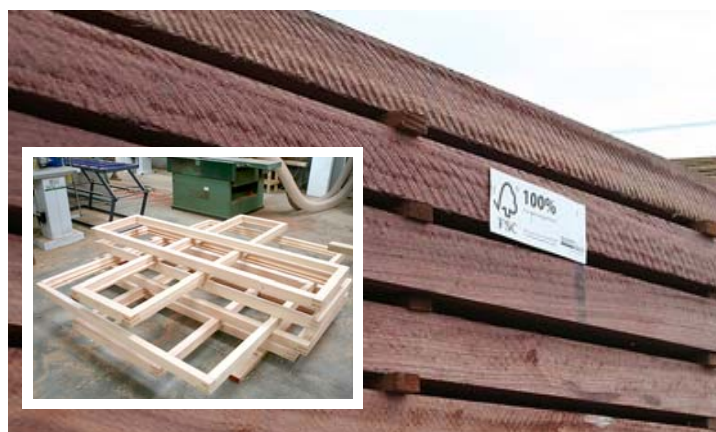
"Ik werk hoofdzakelijk met FSC-gelabeld hout. In feite zou de timmerman altijd moeten kiezen voor dergelijk hout"

"Ondanks de onheilspellende berichten over een nakende crisis, ben ik vrij gerust in de toekomst. 2008 was ook een crisisjaar, terwijl het voor mij het drukste jaar ooit was. Niettemin is het zeer jammer dat de belastingsvermindering voor lage-energiewoningen en passiefwoningen is opgeheven", gaat hij verder. "Zonder die subsidies haken sowieso potentiële klanten af." □